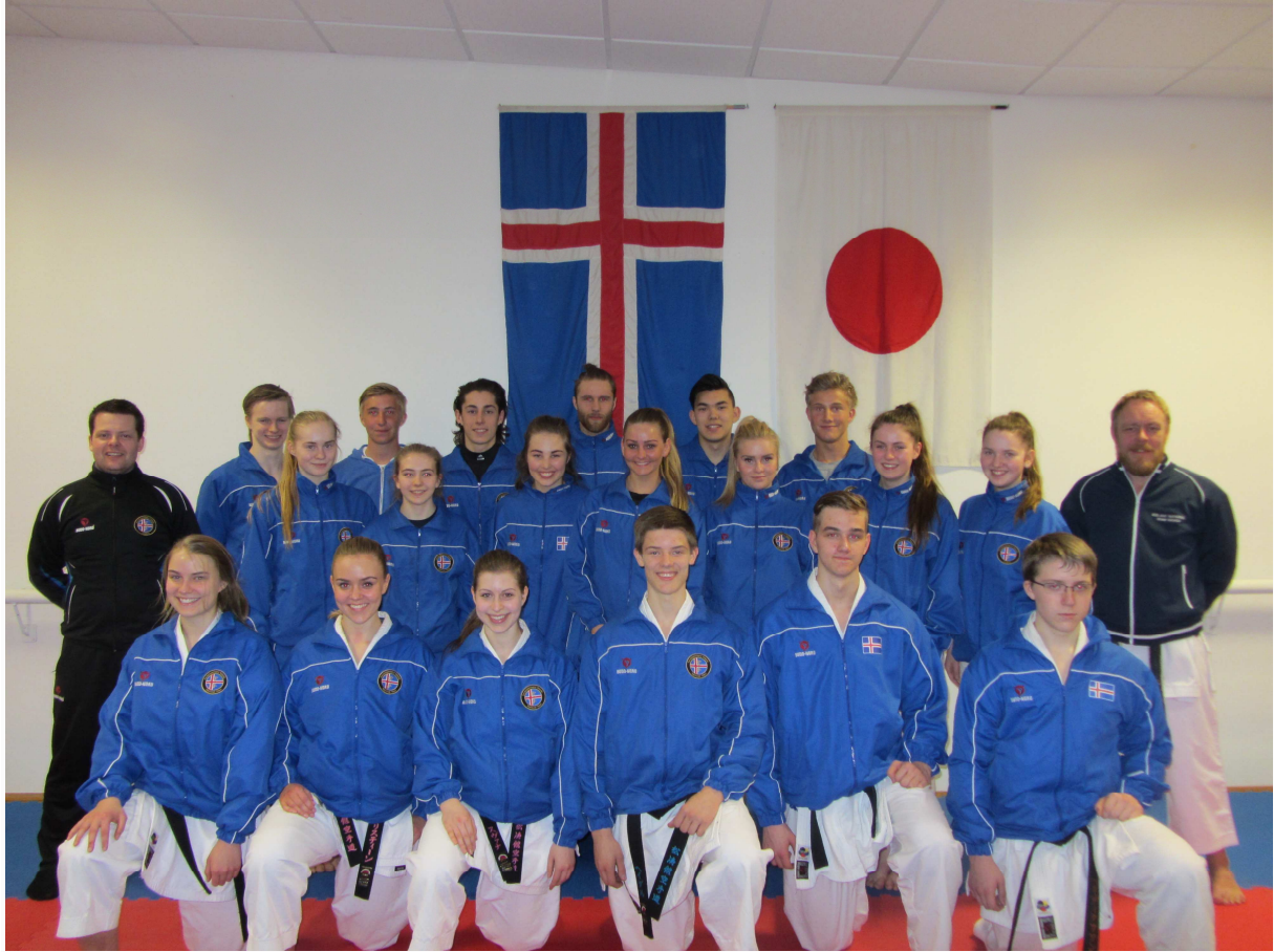
Landsliðið í karate auk landsliðsþjáfara fyrir NM.